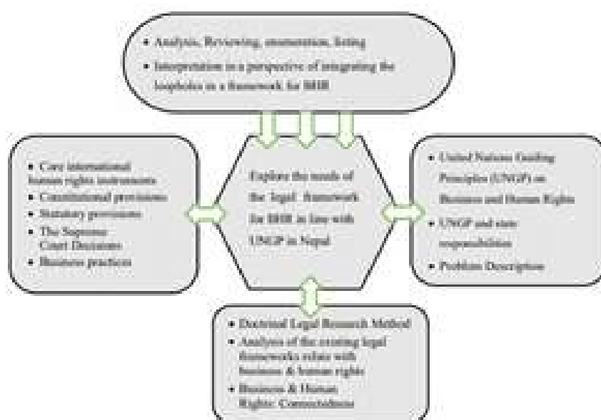
Figure 1: Conceptual Framework of the study

of action or to present a preferred approach to the topic and objectives set in this study. This study intends to study the international legal regime which relate with the constitutional, legal, and policy provisions of the country in terms of the United Nations Guiding Principles (UNGPs) on Business and Human Rights. For the sake of the development of the protect, respect and fulfill framework of the human rights, the UNGPs on business and human rights facilitates the states to incorporate the principles and provisions that are set in the UNGPs. Hence, this study intends to view the existing domestic legal frameworks that are directly or vicariously relate with the issues related with the businesses and human rights. Further, the existing legal framework may provide the baseline so as to it can be traced out the loopholes and strengths of them. Eventually, UNGPs can be endorsed and implement in the desired sectors to enhance the broader human rights realization, and implications in the social reality.