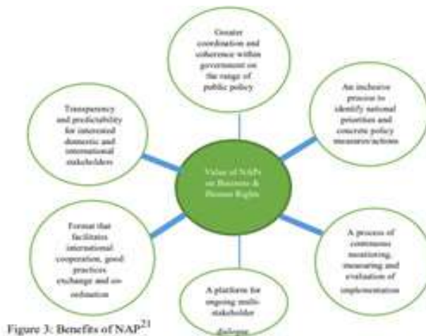
Figure 3: Benefits of NAP 1

In 2014, the UN Human Rights Council endorsed its expectation for states to adopt National Action Plan (NAP) as a means of implementing the UNGPs within their respective territories and jurisdiction. The UN Working Group on Business and Human Rights 'strongly encourage[d] all states to develop, enact, and update a national action plan as part of the state responsibility to disseminate and implement the Guiding Principles on Business and Human Rights.'