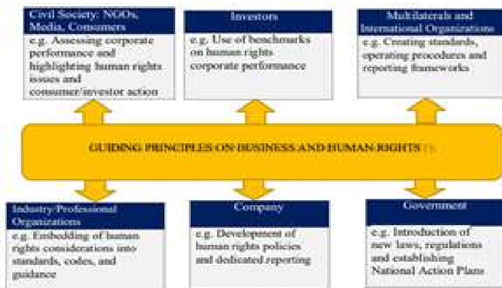
Figure 4: Influence of the UN Guiding Principles on Business and Human Rights 6 Human Rights and Business Road Map

The human rights and business road map encapsulates the 10 areas for consideration, related to identifying, implementing and reviewing/re-evaluating policies, practices and processes related to human rights concerns within the organization and the wider operating environment. Embedding human rights consideration into the business, particularly in complex organizations, is an incremental process. However, the sooner the journey begins the faster will progress be made towards mitigating risks and realizing opportunities. The key to progress is enabling relevant and material and material information to be incorporated into management, reporting, analysis, and decision making. The businesses can contribute to enabling responsible business and respect for human rights by collaborating, responding to stakeholders' legitimate interests, and assessing performance in a transparent manner to improve future outcomes: