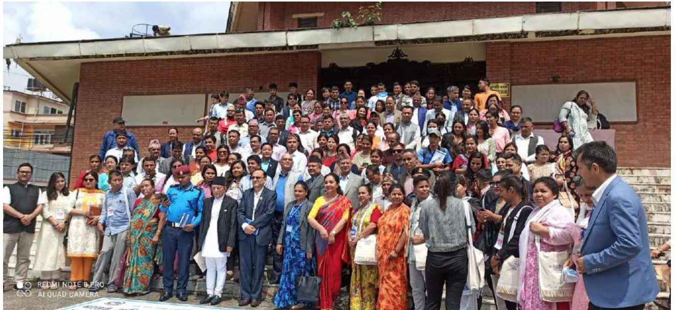
प्रदेश नं. १ (कोसी) मानव अधिकार रक्षक सम्मेलन तस्विरहरु