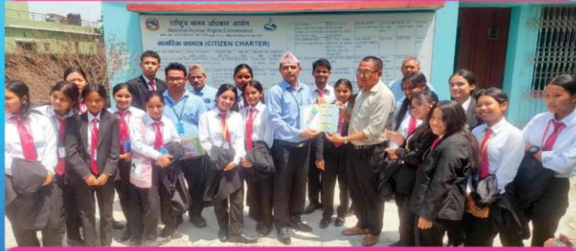
इटहरी नमूना कलेज, सुनसरीका कानून सङ्कायमा अध्ययनरत विद्यार्थीहरू