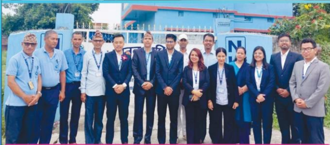
राष्ट्रिय मानव अधिकार आयोग कोशी प्रदेश विराटनगरमा कार्यरत कर्मचारीहरू