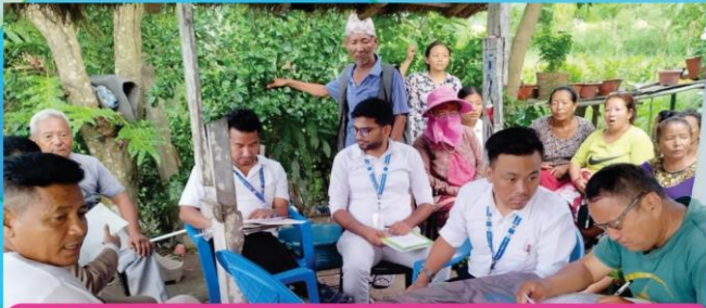
सुनसरी जिल्ला वराहक्षेत्र नगरपालिका वडा नं. ८ मा निर्माणाधीन धनकुटा-दुहबी-ढल्केबर ४०० केभी हाइटेन्सन लाइनको प्रभाववारे अन्तरक्रिया