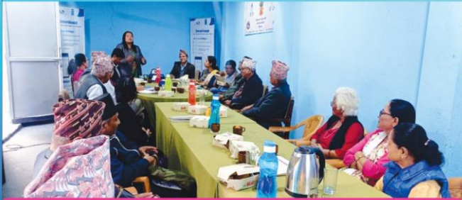
ज्येष्ठ नागरिकको अधिकार विषयक छलफल कार्यक्रम कार्यालयको सभाहलमा