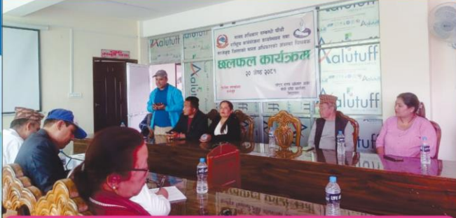
मानव अधिकार सम्बन्धी पाँचौँ राष्ट्रिय कार्ययोजना कार्यान्वयन तथा ताप्लेजुङ र पाँचथरको मानव अधिकारको अवस्था विषयक छलफल कार्यक्रम