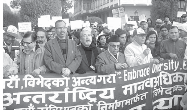
६९औं मानवअधिकार दिवसका अवसरमा काठमाडौंमा आयोजित मानवअधिकार महाभेलामा च्याली सम्बोधन गर्दै आयोगका अध्यक्ष