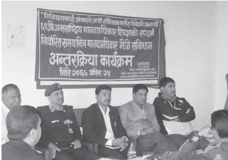
६१औँ मानवअधिकार दिवसमा आयोगको पूर्वाञ्चल क्षेत्रीय कार्यालयले विराटनगरमा आयोजित अन्तरक्रियामा सहभागीहरू