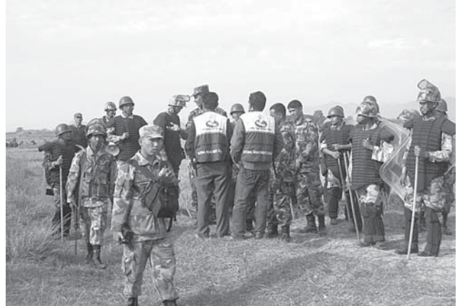
बाँके जिल्लाको रनियापुरमा जग्गाकब्जासम्बन्धी विषयमा अनुगमन गर्न पुगेको आयोगको टोली सुरक्षाकर्मीहरूसँग सोधपुछ गर्दै

राजनीतिक गतिविधिका कारण शान्ति सुरक्षाको अवस्थामा उतारचढाव देखिएको छ, यो महिना। नागरिक सर्वोच्चताको मुद्दा उठाएर एकीकृत नेकपा (माओवादी) ले राष्ट्रपति, प्रधानमन्त्री, मन्त्रीहरू र सत्तापक्षका मुख्य नेताहरूलाई कालो भण्डा देखाउने, कार्यक्रम विथोल्न ढुङ्गामुढा गर्ने, नाराबाजी गर्ने, सडक अवरुद्ध पार्ने जस्ता गतिविधि गरिरह्यो, जसबाट सुरक्षाकर्मी र प्रदर्शनकारीहरूबीच मुठभेड र भडपको स्थिति सिर्जना भयो। त्यस्तै, साउन महिनादेखि लगातार अवरुद्ध रहेको संसद मड्सिर महिनामा पनि खुल्न नसक्दा नागरिक अधिकारका विभिन्न ऐनकानून तथा नीतिनिर्माण कार्य अवरुद्ध भयो। तर, मड्सिर २५ गते ६९औं अन्तर्राष्ट्रिय मानवअधिकार दिवस परेकाले अधिकारकर्मीहरूको अनुरोधमा मड्सिरको पछिल्लो हप्ता माओवादीले विरोध कार्यक्रम फिर्ता लिएको थियो।