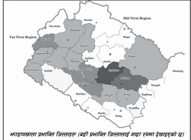
भ्रूडापखाला प्रभावित जिल्लाहरू (बढी प्रभावित जिल्लालाई गाढा रंगमा देखाइएको छ)

मध्य तथा सुदूरपश्चिमाञ्चलका जिल्लाहरूमा फैलिएको भ्रूडापखाला र नागरिकको स्वास्थ्यको अधिकारसम्बन्धी राष्ट्रिय मानवअधिकार आयोगले तयार पारेको प्रारम्भिक स्थलगत अनुगमन प्रतिवेदन सार्वजनिक गरिएको छ। गत साउन २० गते सार्वजनिक गरिएको उक्त प्रतिवेदनमा जाजरकोट र आसपासका जिल्लाहरूमा गत जेठ-असार महिनामा फैलिएको भ्रूडापखाला/हैजा रोगबाट सयौंको मृत्यु र हजारौं मानिसहरू रोगबाट प्रभावित भएको सम्बन्धमा आयोगका टोलीहरूले स्थलगत अनुगमन गरेका थिए। यस क्रममा आयोगको टोलीले जाजरकोट, रुकुम र सुर्खेत जिल्लाको स्थलगत भ्रमण, स्वास्थ्यकर्मी, पीडित व्यक्तिहरू, सरकारी निकायलगायत विभिन्न सरोकारवालासँग भेटघाट, छलफल तथा अन्तर्क्रिया गरेको थियो।