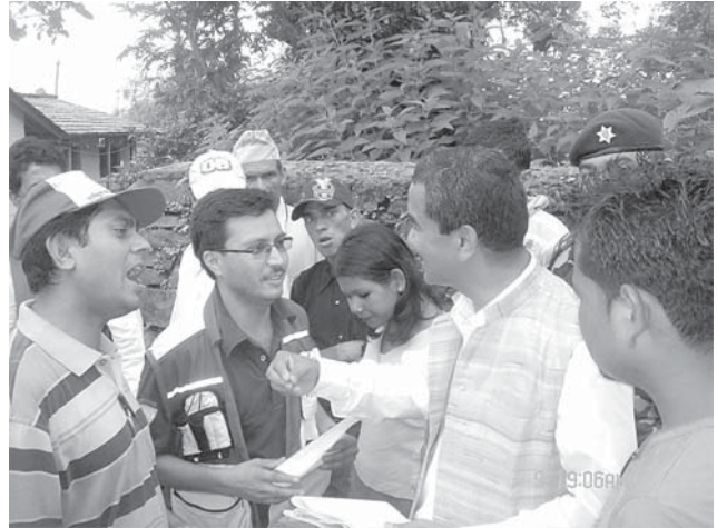
स्थलगत अनुगमनका क्रममा शान्ति राज्यमन्त्रीसँग स्वास्थ्य अवस्थाबारे जानकारी लिँदै आयोगको टोली

दिसा मिसिएको प्रदूषित पानीको प्रयोग रोग फैलिने मुख्य कारण भएको आयोगको टोलीले जनाएको छ। स्वास्थ्य केन्द्रहरूमा प्रकोप आरम्भ भएको सुरु समयमा जीवनजल र औषधीहरू समेत नभएको अवस्था थियो। जिल्लामा ल्याब परीक्षणको व्यवस्था नभएको हुँदा परीक्षणविना नै विरामीहरूलाई औषधी वितरण गरिँदा नागरिकको स्वास्थ्यलाई अझ बढी जोखिममा पारेको थियो। स्वास्थ्य चौकीहरूमा दरबन्दीअनुसार स्वास्थ्यकर्मी नभएकाले रोग समयमा नै नियन्त्रण हुन नसकेको टोलीको ठहर छ। अज्ञात सरुवा रोग फैलिरहेको भन्ने त्रास र भय जनमानसमा रहेको कारण विरामीका आफन्त र छरछिमेकीले समेत विरामीलाई उपचारमा लैजाने गरेकाले मृतकहरूको सङ्ख्या बढेको हो। विभिन्न संस्थाहरूबाट विक्रीवितरण गर्ने खाद्यान्न (दाल, चामल) को गुणस्तरमा समेत आशङ्का गरिएको अवस्था छ।