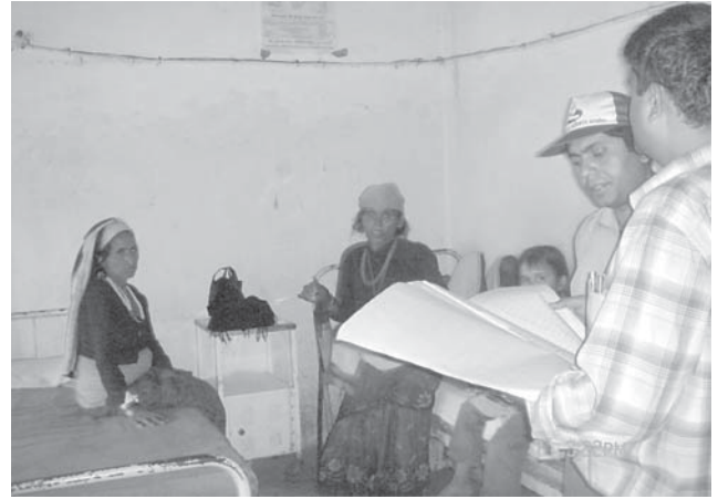
जाजरकोटमा भाडापखालाका बिरामीहरूको अवस्थाबारे जानकारी लिँदै आयोगको टोली

स्वास्थ्यकर्मीहरूको मनोबल उच्च राख्न थप प्रोत्साहन भत्ता, उचित खानपिन र बसोबासको व्यवस्था, जीवन बीमाको व्यवस्था तथा निश्चित समयवाधि किटानगरी पठाउनु पर्ने ।