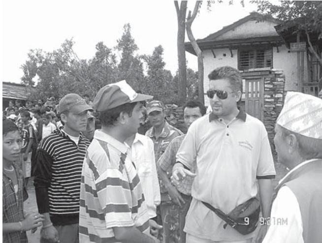
मानवअधिकारको अवस्थाबारे सर्वसाधारणसँग जानकारी लिँदै आयोगको टोली